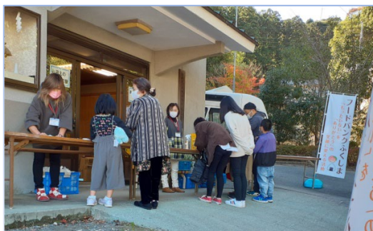
金比羅神社での配布会に親子で参加

※昨年7月に開設以来、毎月300キロぐらの食料を配布。大きな倉庫があるとのことで頼もしいですね】