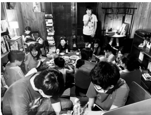
まかない子ども食堂たべまな